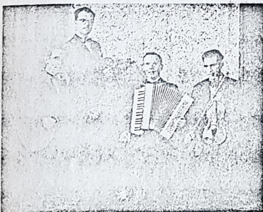
Cimermanov kvartet bomo slišali v radiu 26. februarja ob 17.30.

Podobne trditve prihajajo navadno iz vrst ljudi, ki dela radiopostaje sploh ne poznajo ali pa le površno spremljajo.